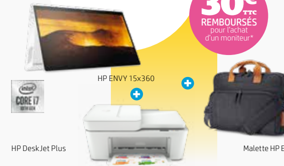
HP DeskJet Plus

+ 30€ TTC REMBOURSÉS pour l'achat d'un moniteur*