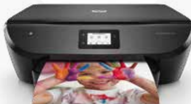
HP ENVY Photo

Pour l'achat d'une imprimante HP ENVY Pro, HP ENVY Photo, HP OfficeJet, HP OfficeJet Pro, HP Smart Tank et HP Sprocket éligible*