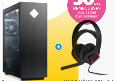
PC GAMER OMEN

+ 30€ TTC REMBOURSÉS pour l'achat d'un moniteur*